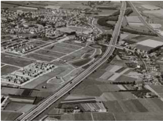
Kom van Prinsenbeek vanuit het zuidoosten. In het midden Rijksweg 16, 1900.