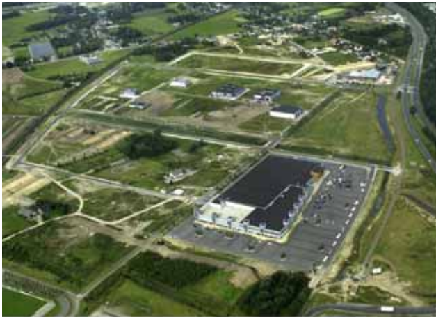
Bouw van de bedrijventerrein in 2001

Kleinschalig agrarisch cultuurlandschap Verbinding Landgoed Burgst Gageldonkseweg historisch relict Laagtes en hoogtes, beekdal-landschap