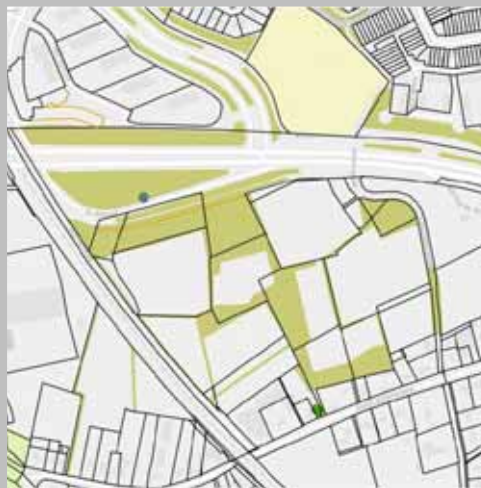
Bodem, luchtkwaliteit, saldering stikstof en energievoorziening