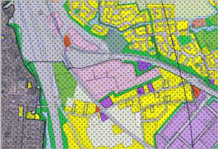
Omgevingsvisie en Bestemmingsplan