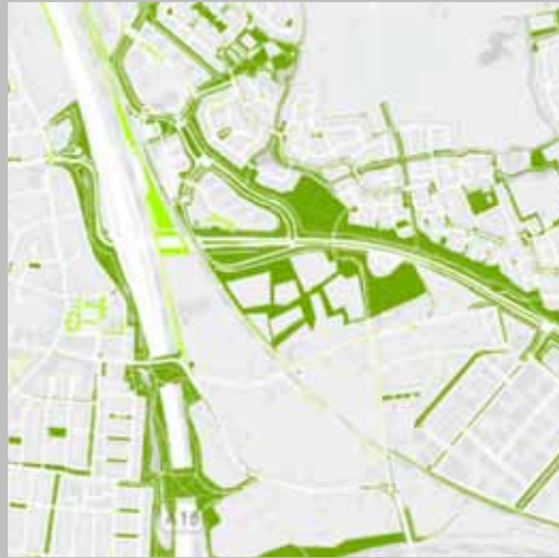
Groenkompas, compensatiebeginsel en kapvergunningen