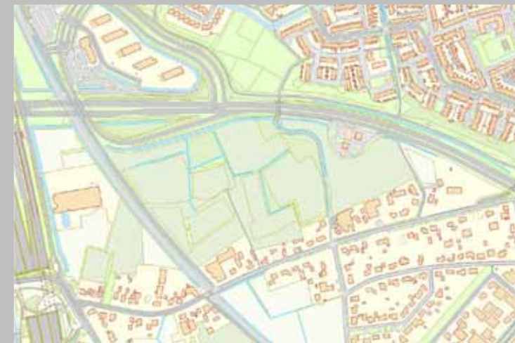
Waterhuishouding, berging en afvoer