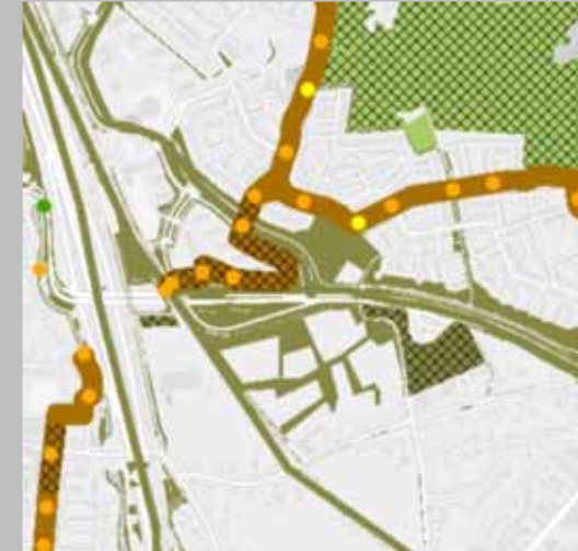
Natuurnetwerk en EVZ ecologische verbindingzone