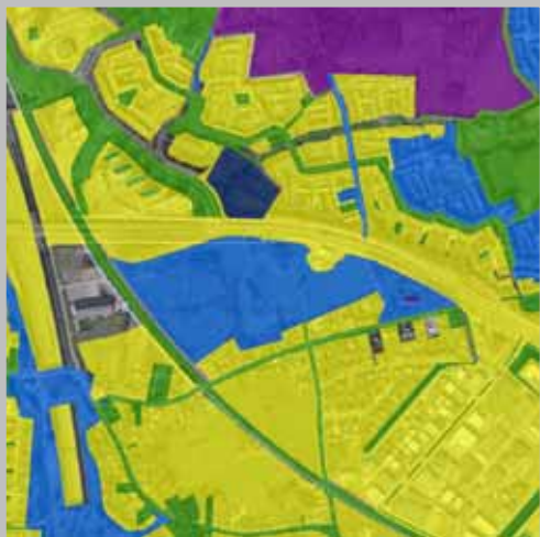
Archeologie en cultuur-historische waarden