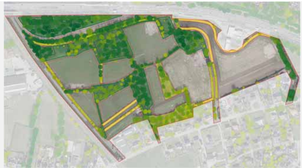
Coulisselandschap met grasland