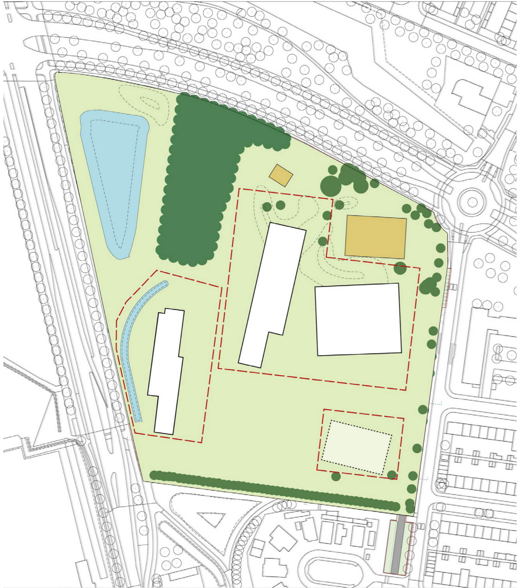
Plaatsing van volumes