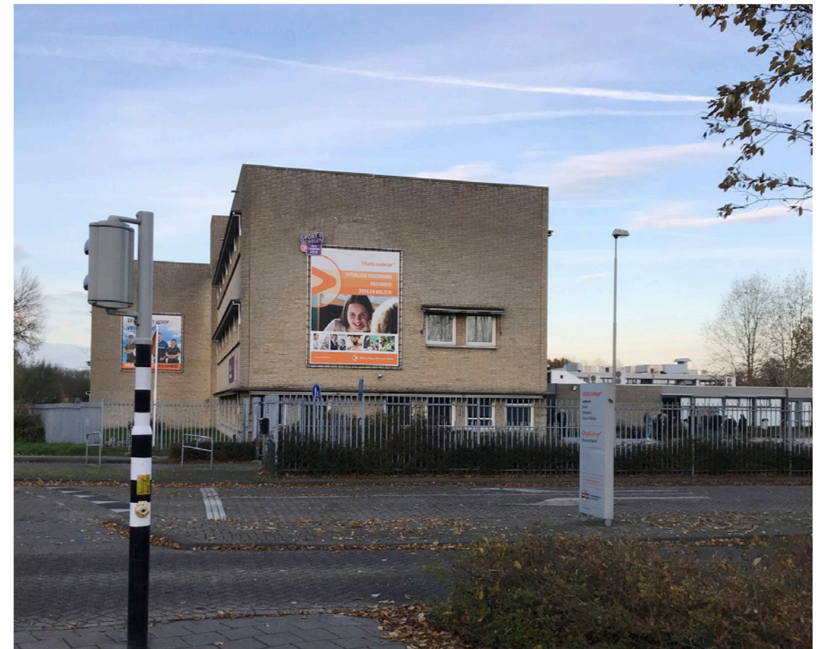
Huidige situatie - Transparant park met sportfuncties in noorden en afgesloten schoolcomplex in zuiden