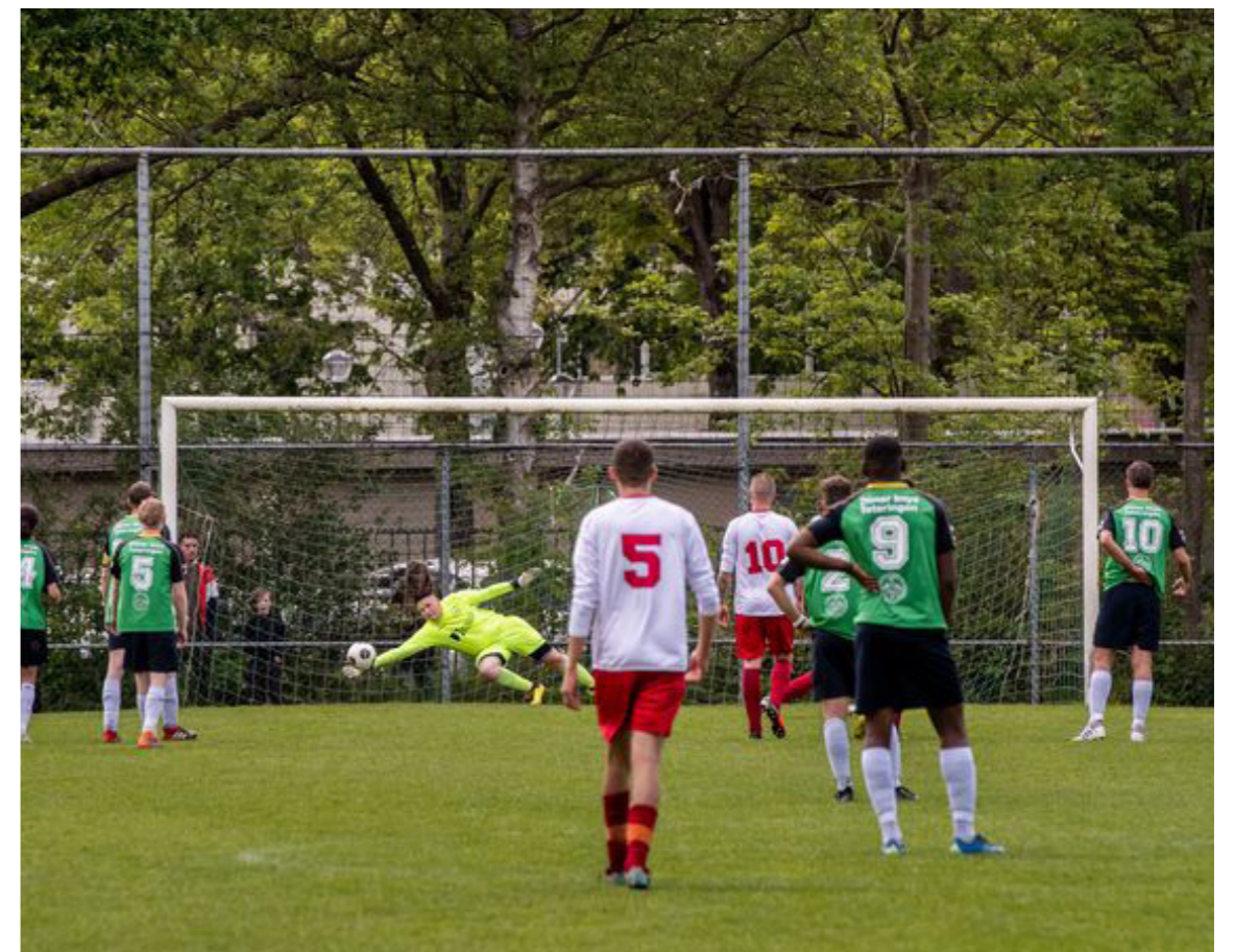
Ligging aan een as van educatieve en sportieve functies