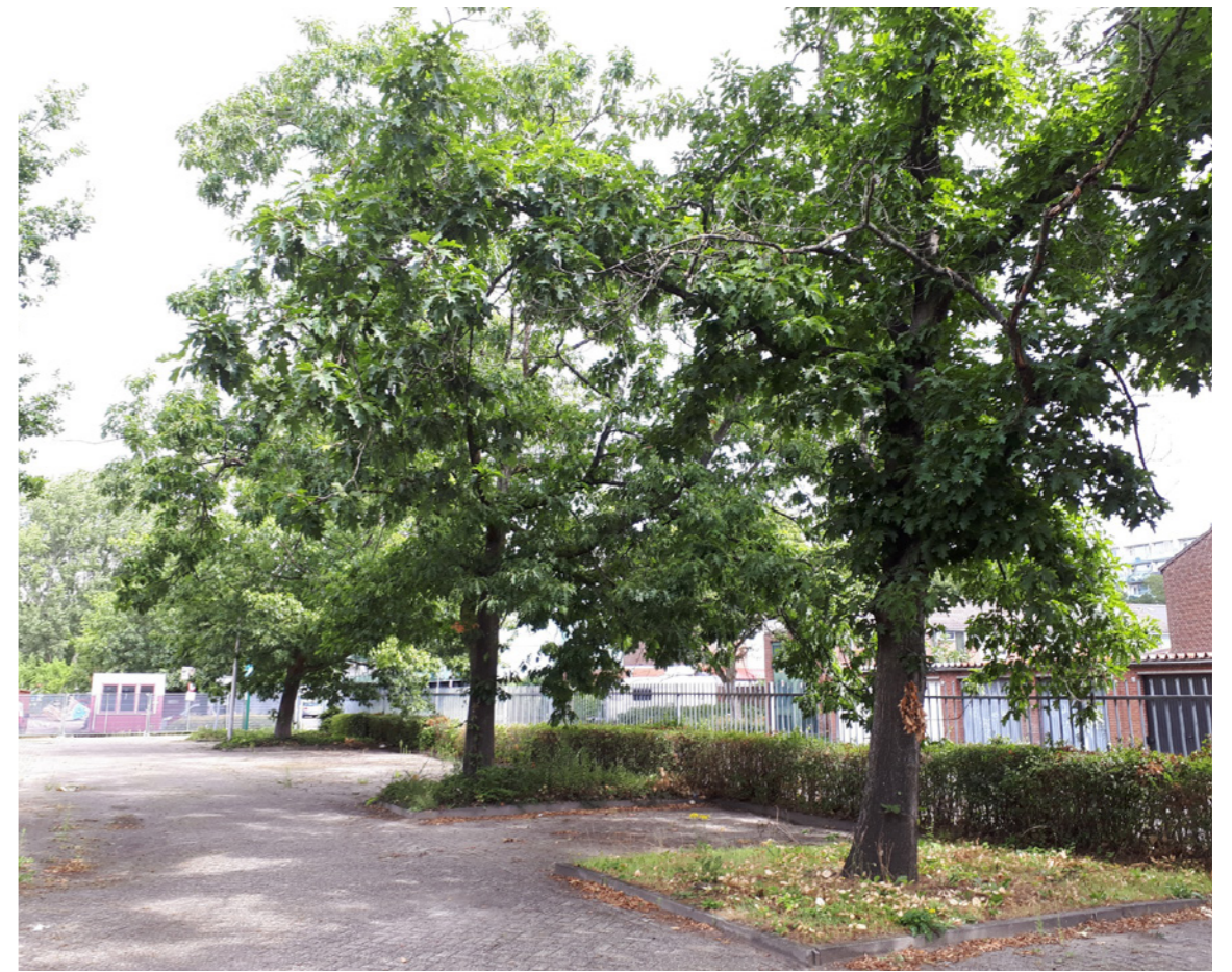
Groen vormt zichtrelaties