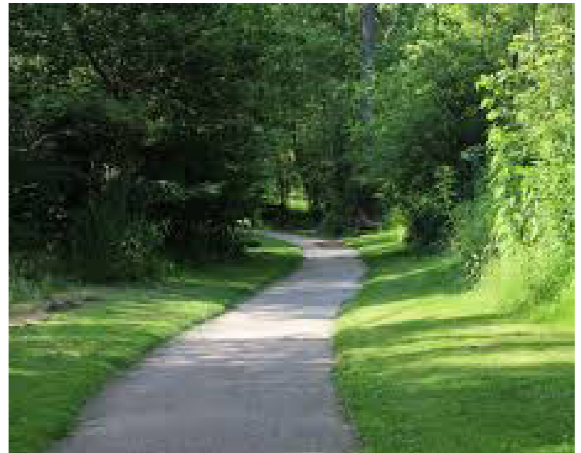
Vormen van routes