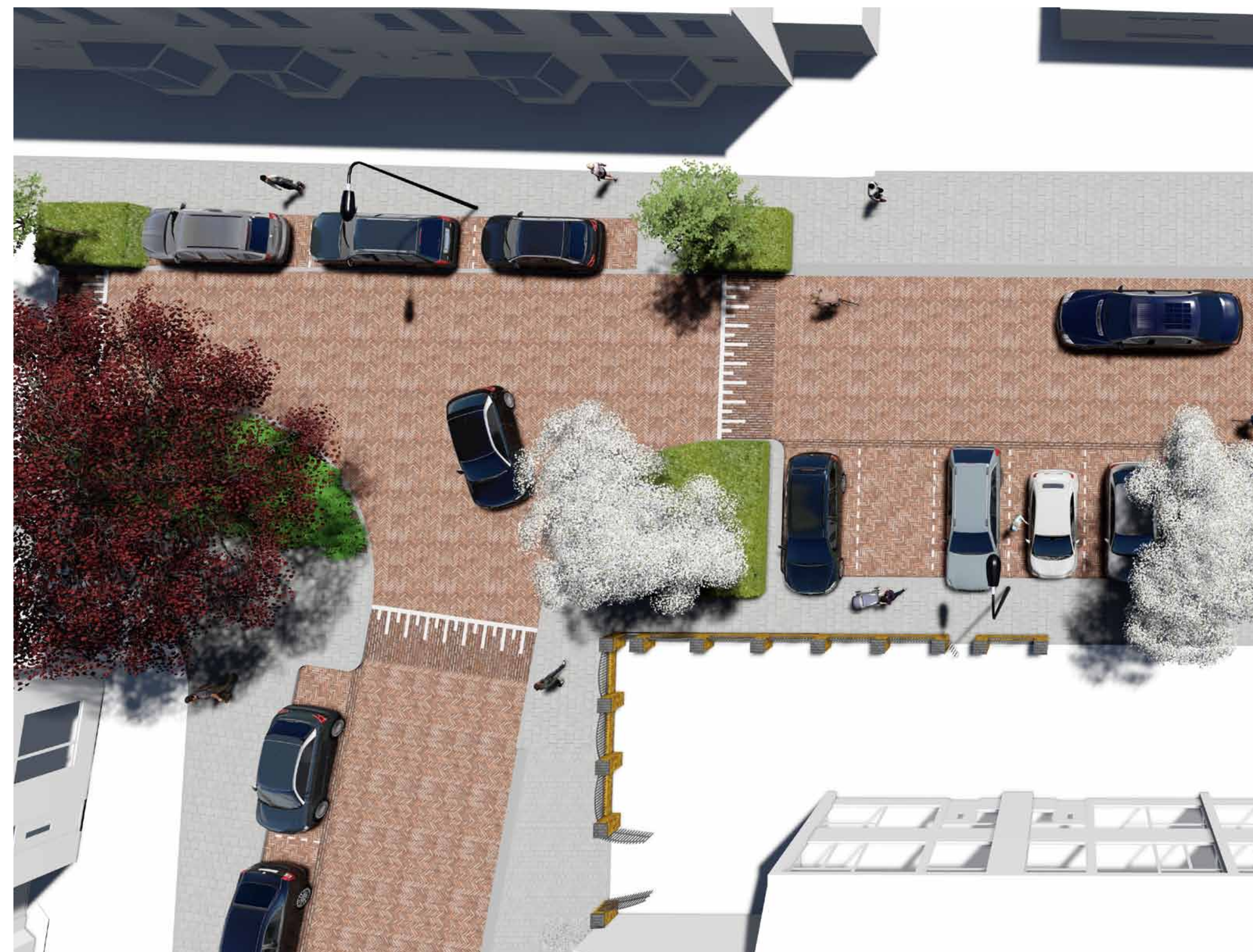
Groen op kruising Lariksstraat en Magnoliastraat heeft plaats gemaakt voor meer parkeren