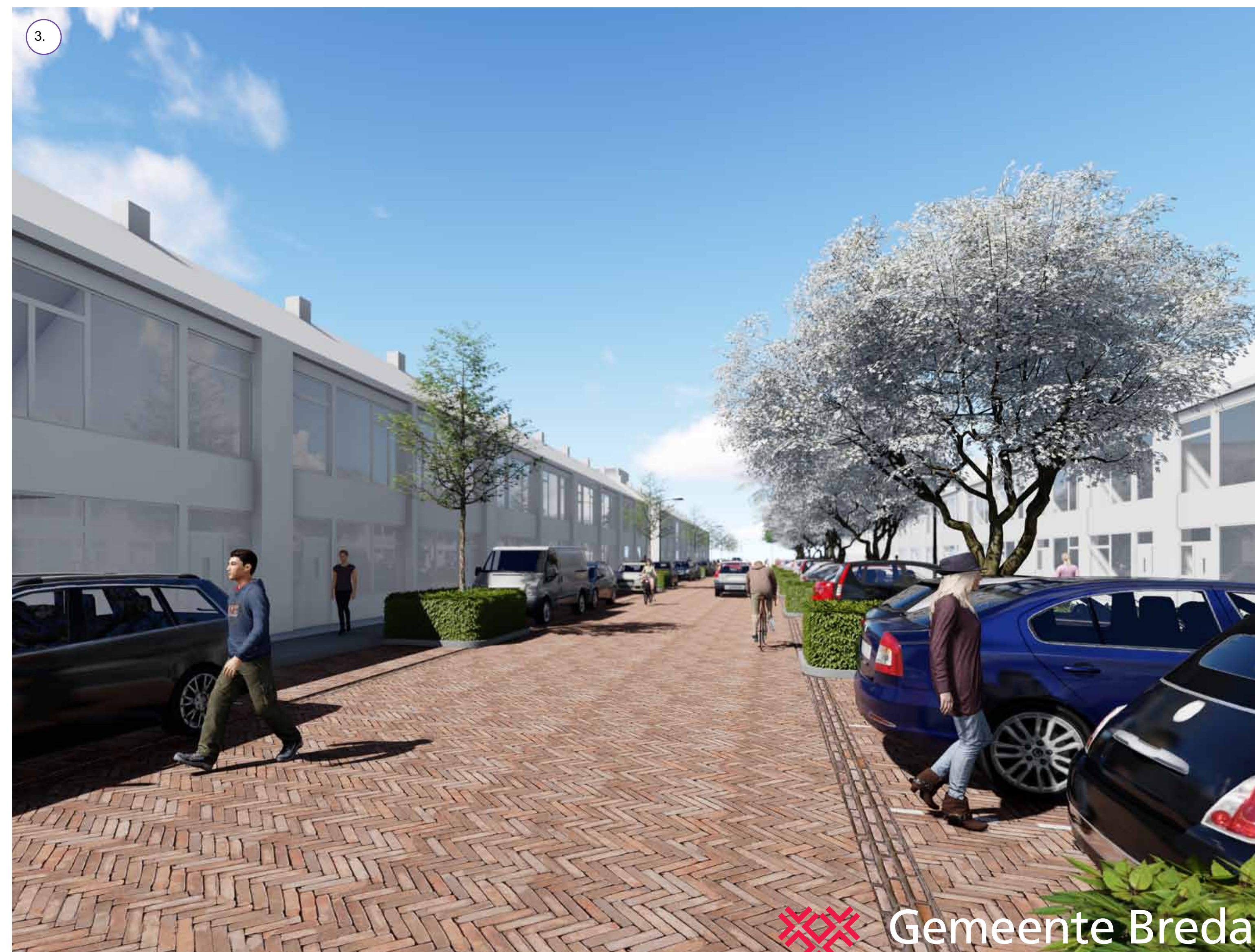
Groen aan beide zijden van de straat.