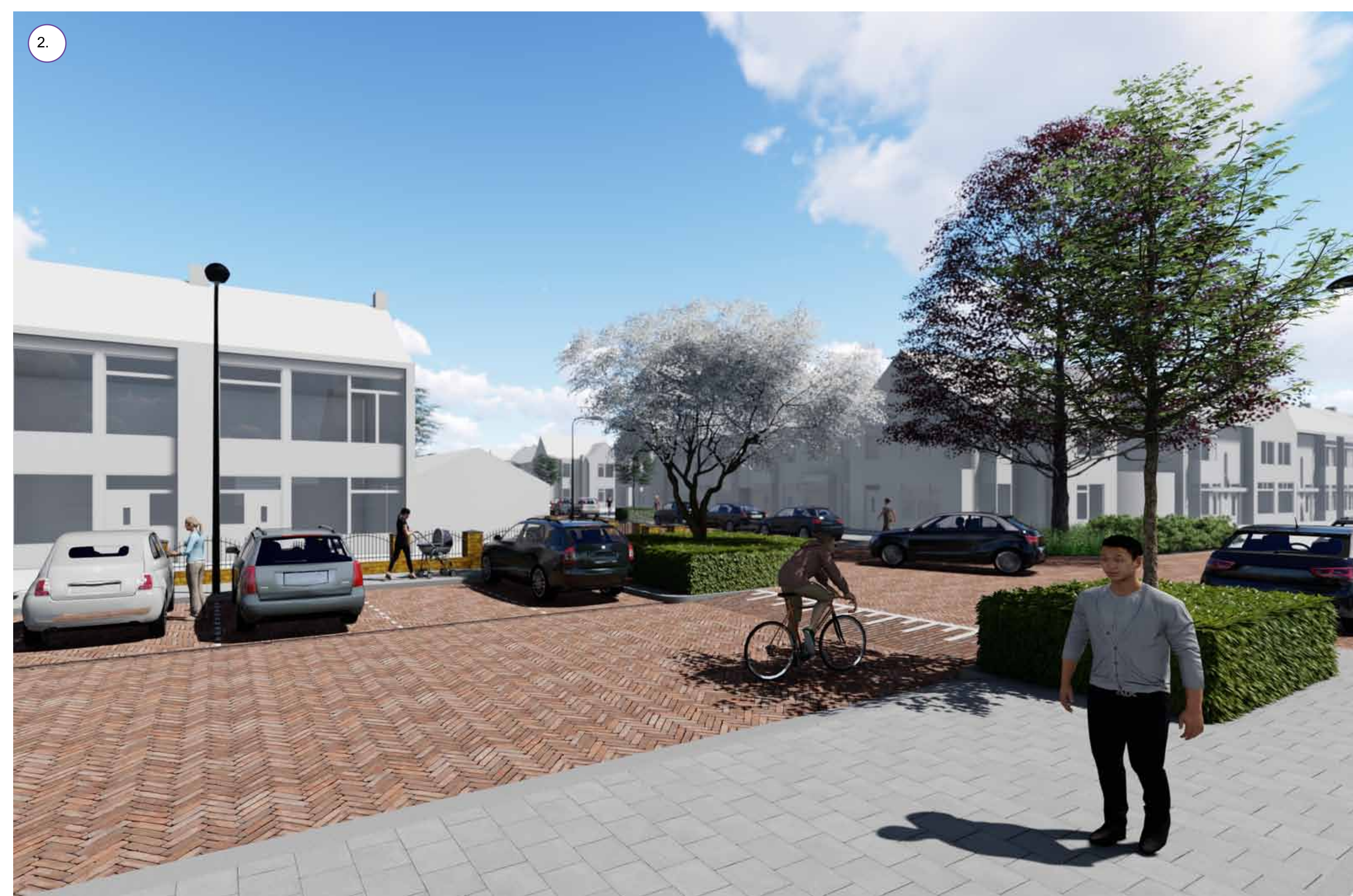
Groene uitstraling kruissing Lariksstraat en Magnoliastraat in combinatie met meer parkeervakken t.o.v. het 1e ontwerp.