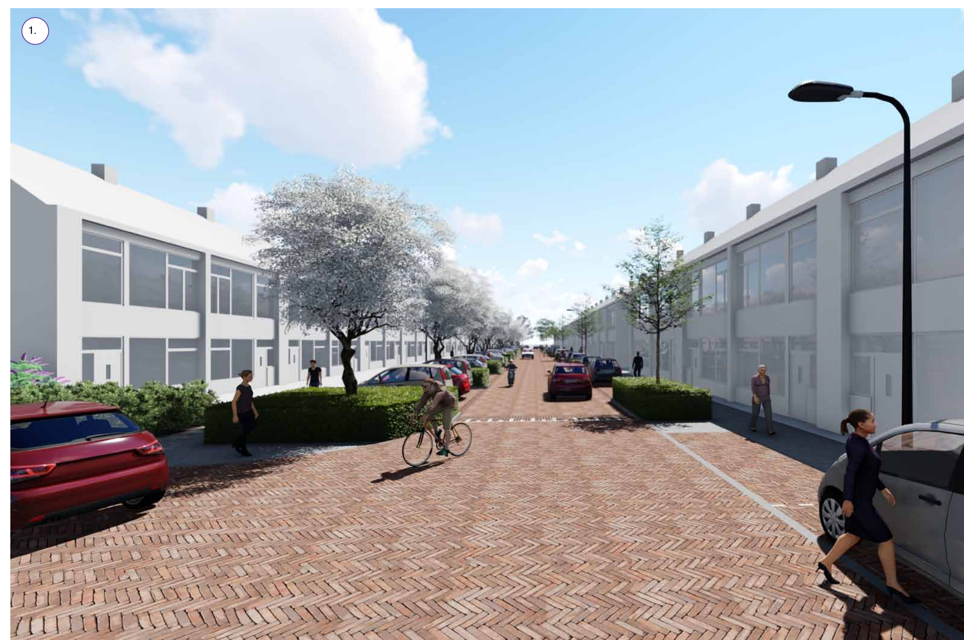
Nieuwe boomvakken aan de zuidzijde van de straat waartussen geparkeerd kan worden