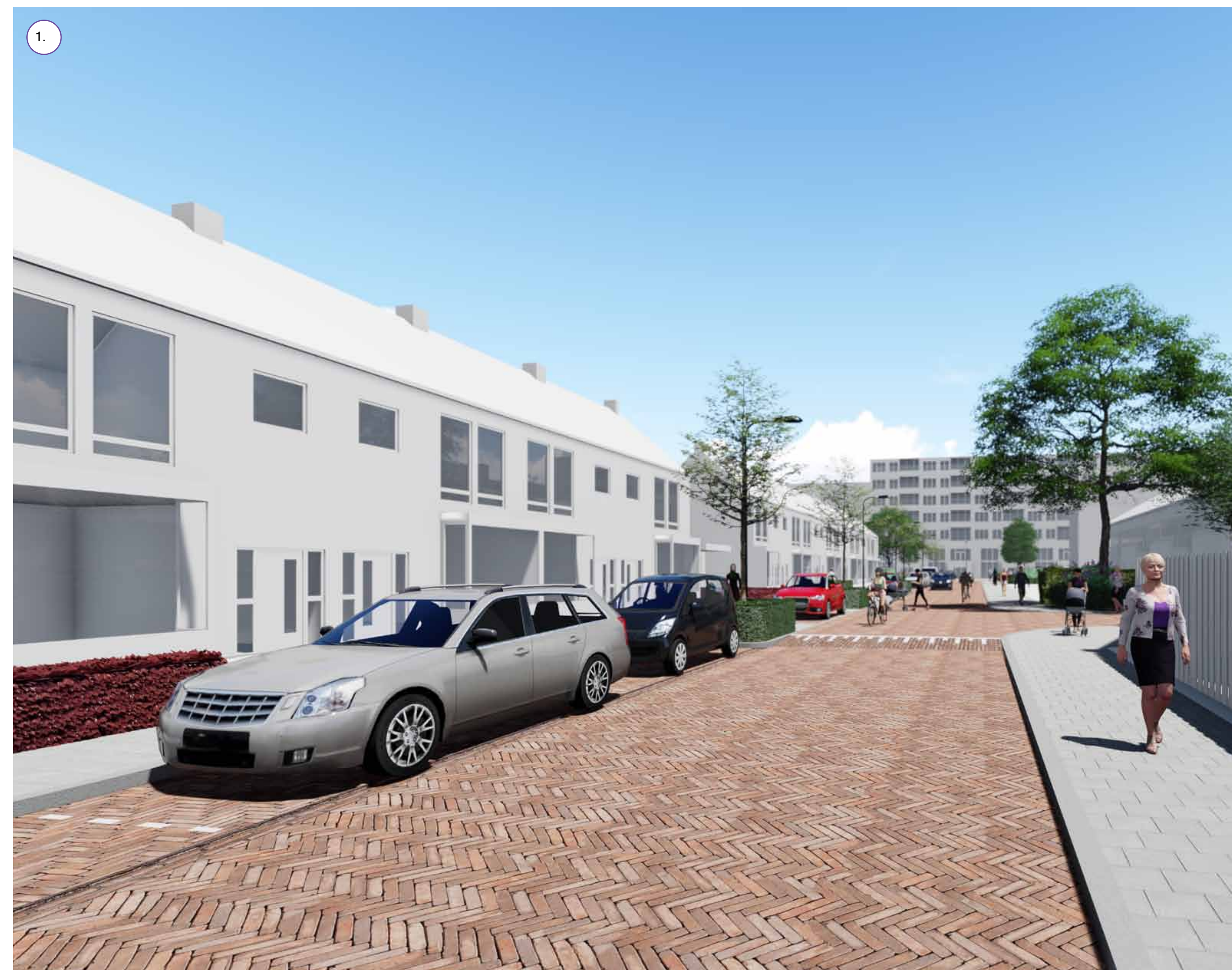
Parkeren in vakken tussen haagblokken en kleine bomen.