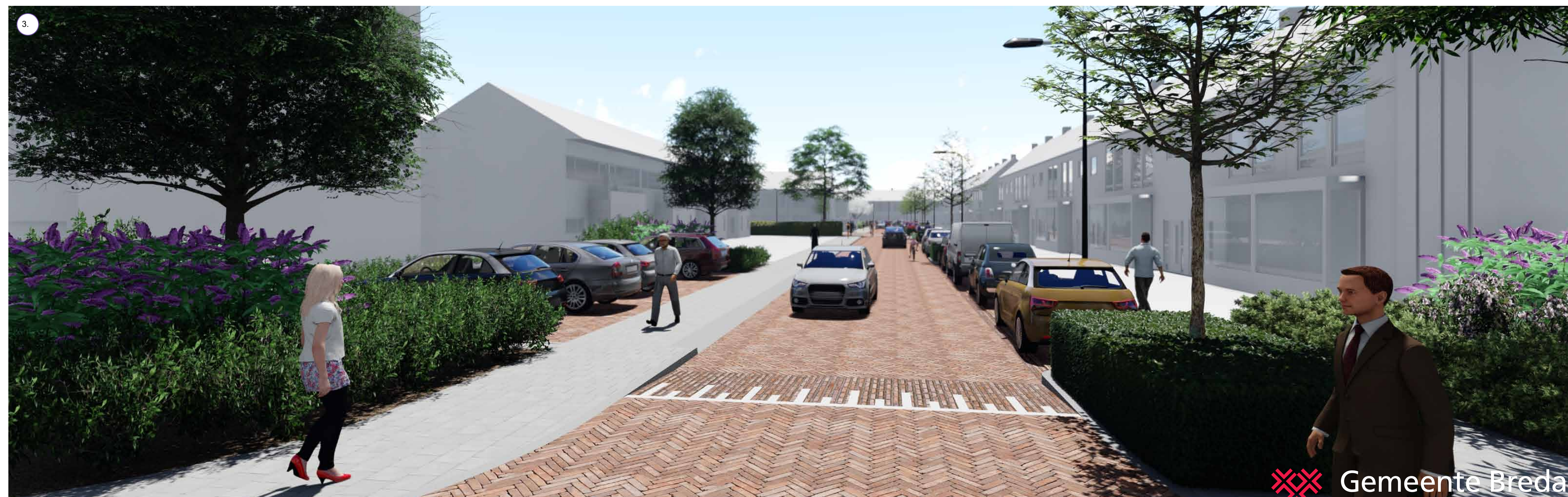
Parkeren tussen boomvakken, meer groen in de straat. De straat krijgt aan de westzijde een nieuwe bomenrij.