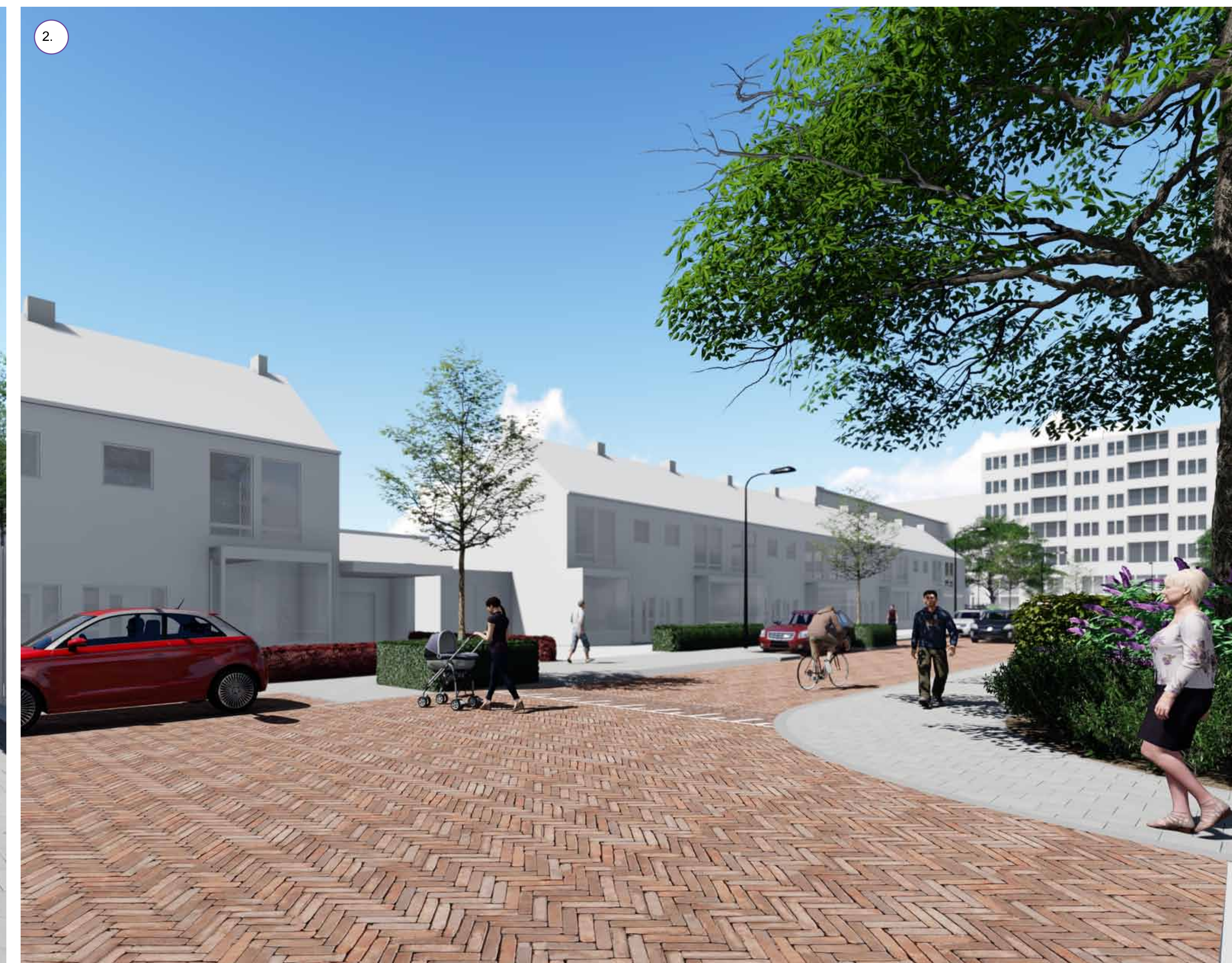
Dichte onderbeplanting van heester en hagen om hondenpoep tegen te gaan.