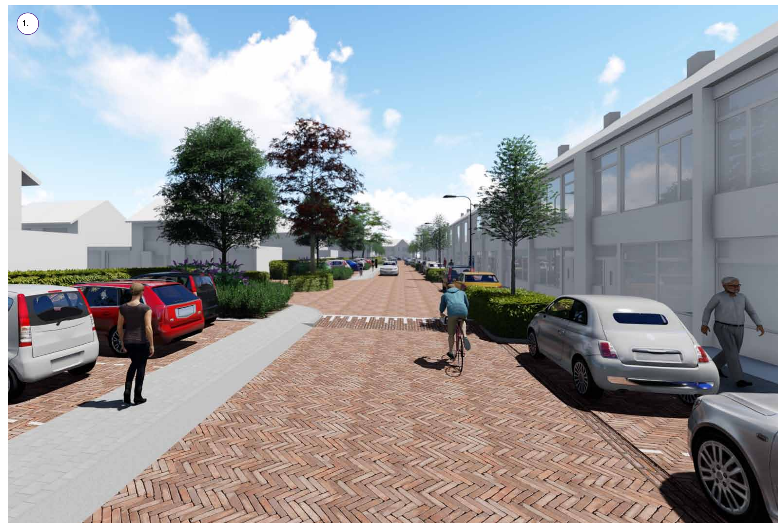
Haagblokken met bomen aan de zuidzijde van de straat