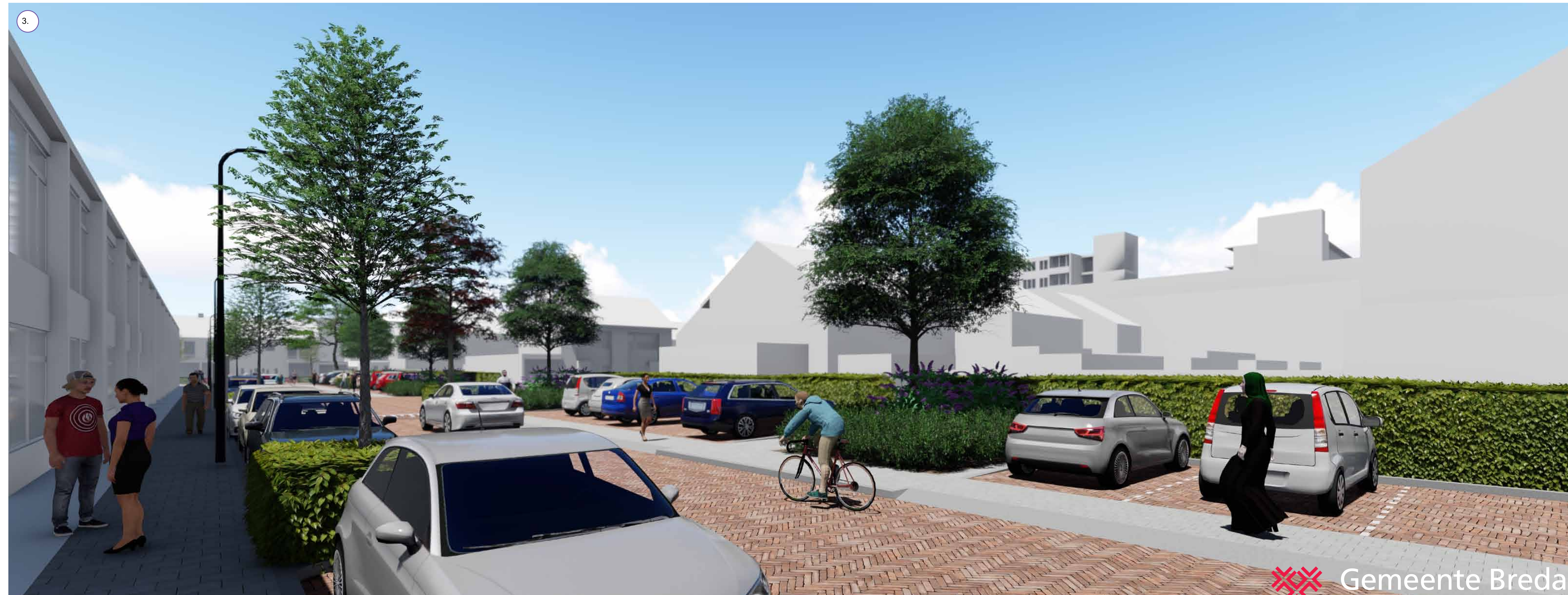
Dichte beplanting en haag voor een groene uitstraling en hondenpoep te voorkomen.