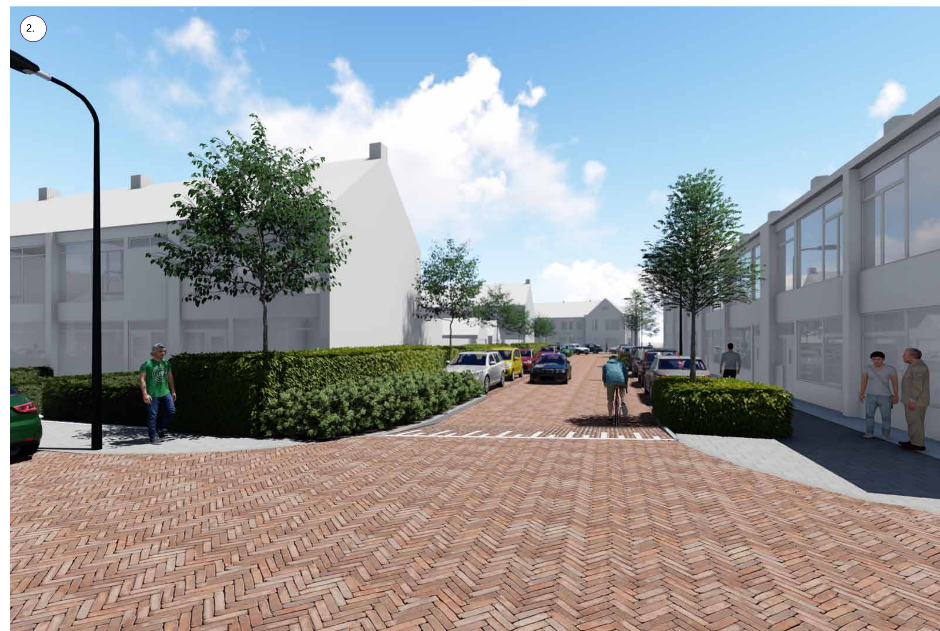
Haag doorgezet met kleine bomen tussen Kamperfoeliestraat en Lariksstraat. Een plek voor mussen en andere vogels.