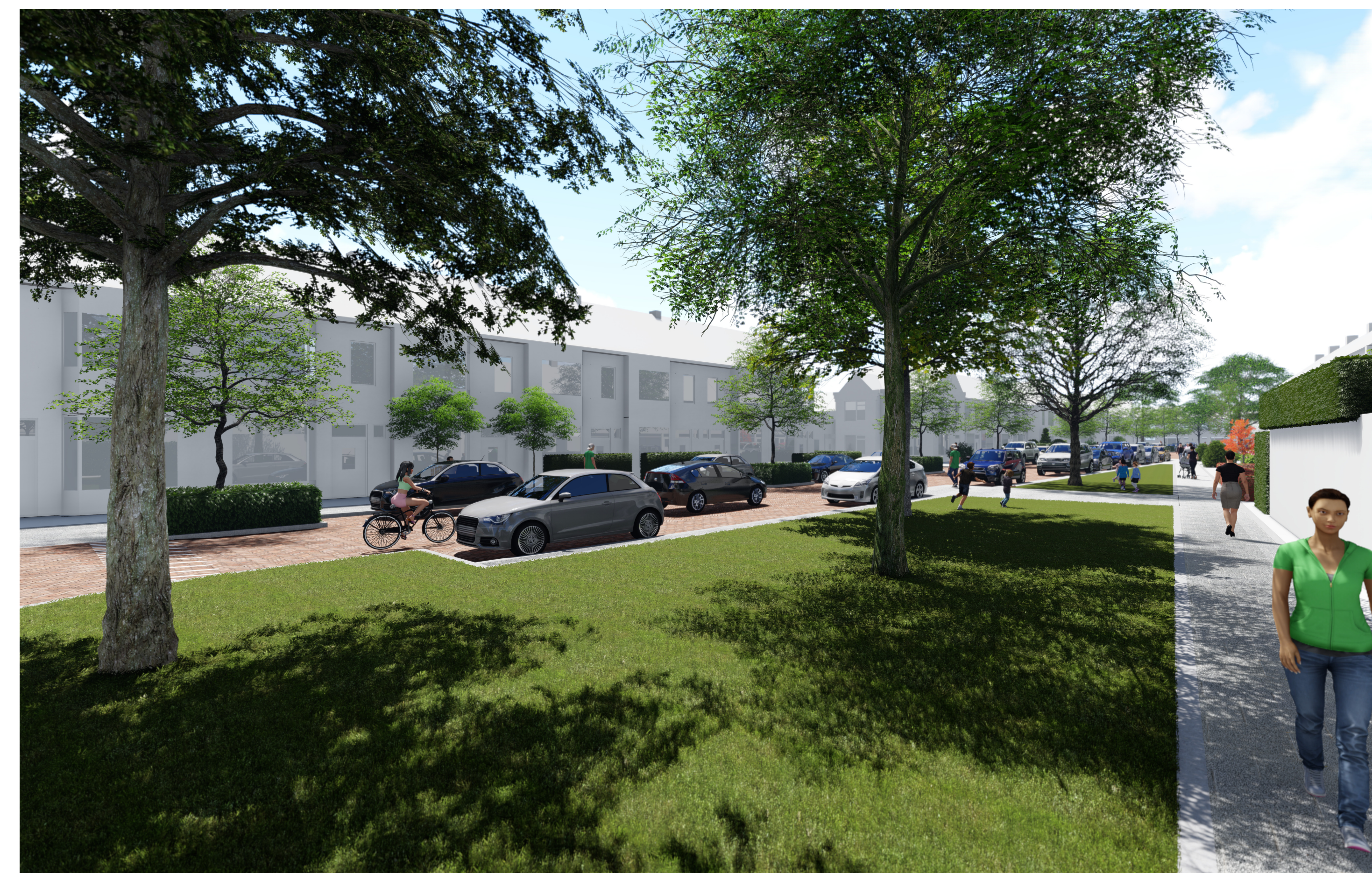
Grote groenstrook met nieuwe bomen die doorloopt tot aan de Oleanderstraat.