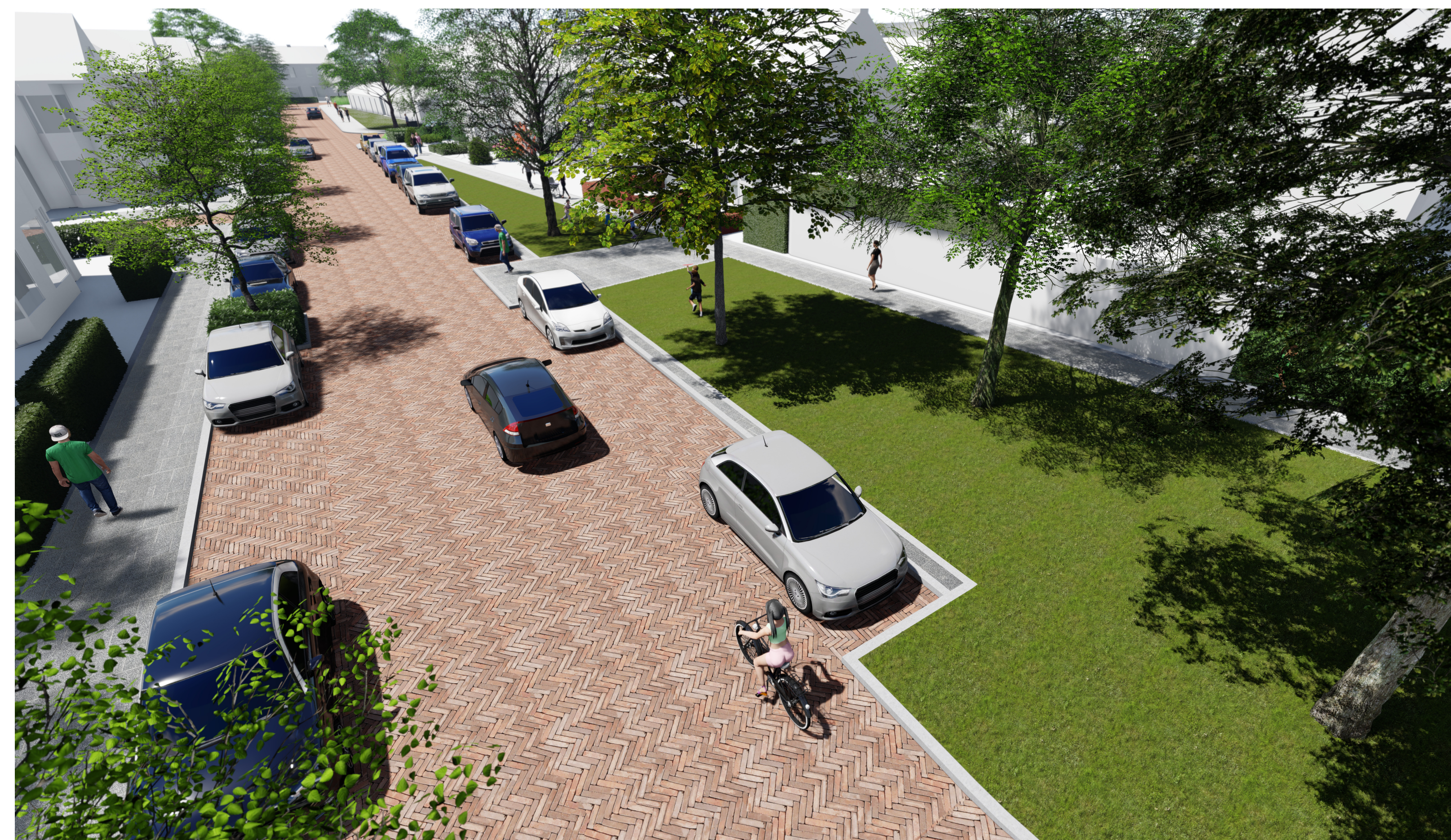
Haaksparkeren worden langsparkeren. Hondenuitlaatveldje gaat weg.