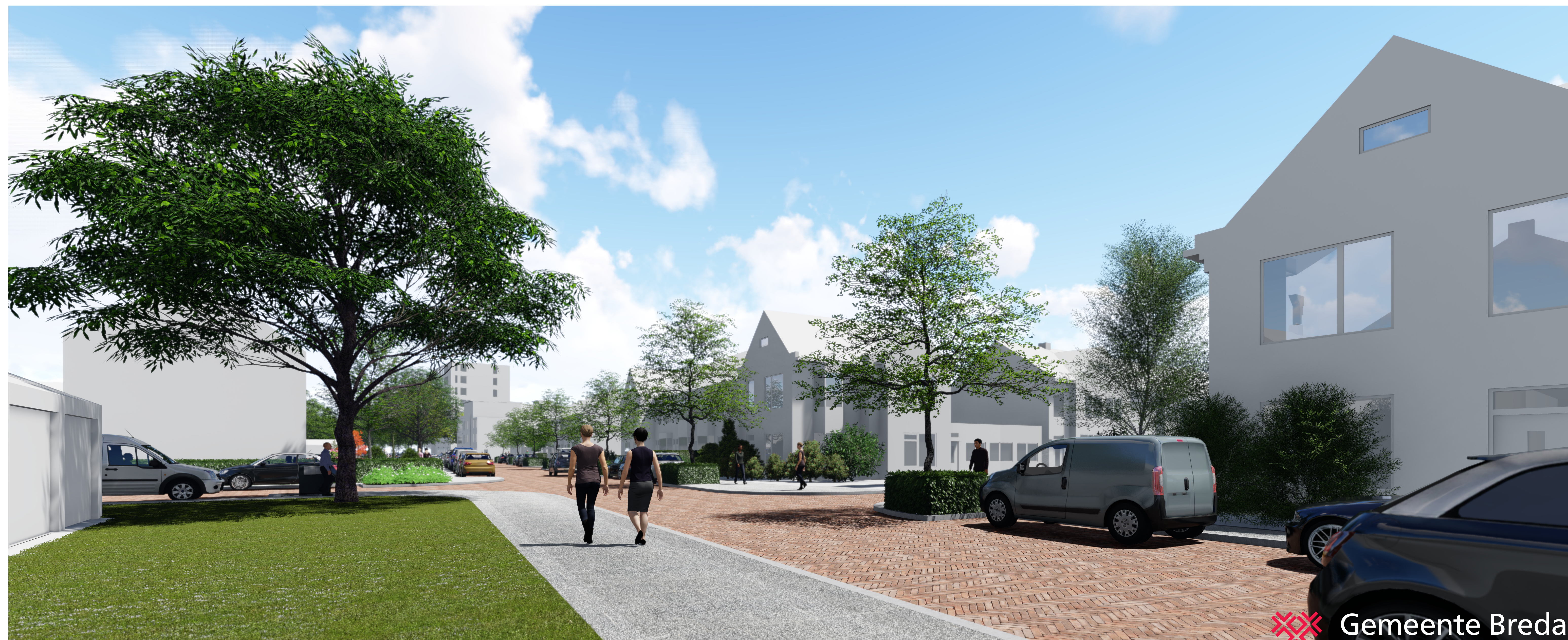
Grasstenen en nieuwe boom op de hoek met de Oleanderstraat. Aan de overzijde worden parkeervakken afgewisseld met bomen.